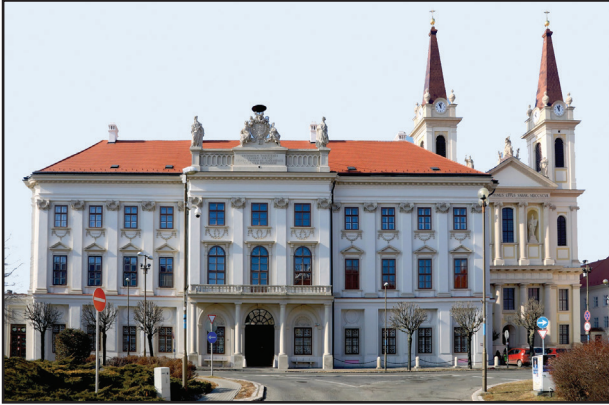
5. kép. A püspöki palota