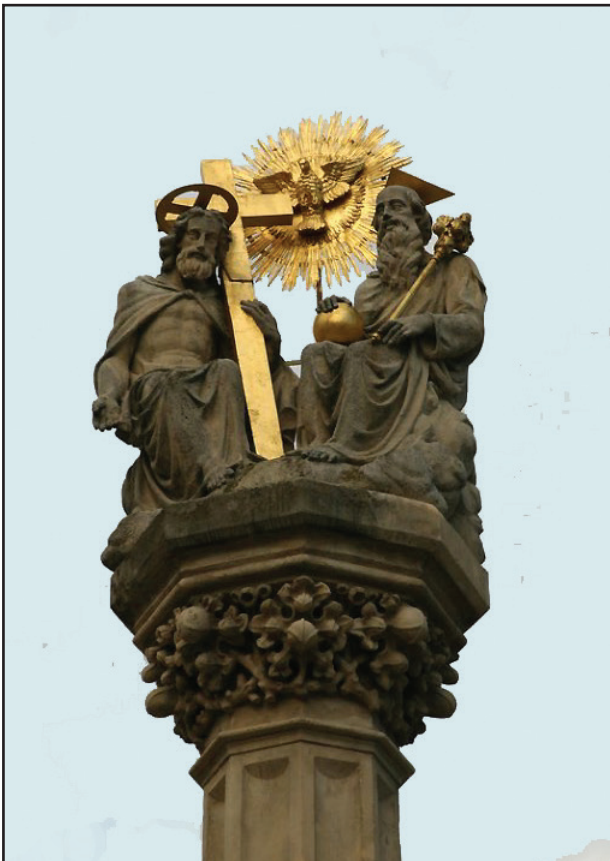
9. kép. A Szentháromság szobor

A székesegyház északnyugati oldalán kerül el a Romkert . Savaria városának romjai 1937-ben, a szeminárium épületének bővítésekor bukkantak elő. Megtalálták az ókori utcakövezet maradványát, a Mercurius-szentély, a fürdő és a helytartói palota alapfalait. A palotát több római császár is meglátogatta. 16x40 m-es dísztermében megmaradtak a IV. sz.-beli mozaikpadló egyes részletei, mintegy 100 m 2 -en (4. kép). Ezeket felszedték, restaurálták, de a bemutatásukhoz szükséges terem még nem készült el. A palota romjaira épült a középkorban a vár és a vártemplom. Ezek a XVIII. sz.-ra tönkrementek, és 1791-ben lebontották őket. Építőanyagukat a helyszínen használták fel.