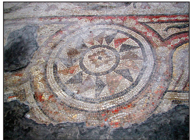
4. kép. A mozaikpadló részlete