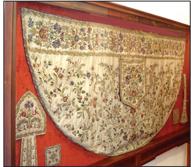
8. kép. A XVIII. sz.-i vecsernyepalást