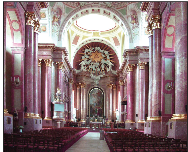
3. kép. A székesegyház belseje

A városközpont legjelentősebb épülete a copf stílusú, kéttornyos székesegyház (2. kép), amelyet az 1777-ben alapított egyházmegye első püspöke Szily János (1777–1799) építtetett, Hefele Menyhért (1716–1794) tervei szerint. Alapkövét 1791-ben tették le és 23 évig tartó építés után, 1814-ben szentelték fel, Szűz Mária nevére. 79 m hosszú, 5000 embert befogadó, egyhajós templom, három-három oldalkápolnával, kereszthajóval (3. kép). Magyarország harmadik legnagyobb temploma. Freskóit és oltárképeit F. A. Maulbertsch, J. Winterhalder és Dorfmeister I., szobrait J. P. Prokop készítette. 1945. március 4-én déltájban amerikai bombatámadás érte, négy bomba talála el. Tetőzete beomlott, orgonája, padjai, festményei elpusztultak. 1947-ben kívülről restaurálták, 2004-re – a mennyezetfreskók kivételével – belülről is helyreállították. (A freskókat fényképek és az eredeti színvázlatok megőrizték az utókor számára.)