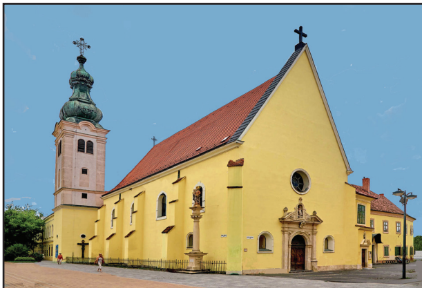
10. kép. A ferences templom

lakosztály ad helyet. A freskókkal díszített földszinti díszteremben (sala terrena, 6. kép) Szily püspök az építkezéseknél felszínre került leletekből kőtárat létesített. (Ez volt az első régészeti kiállítás az országban.) Az emeleti helyiségek eredeti bútorokkal vannak berendezve (7. kép). A falakat festmények díszítik, közöttük a szombathelyi püspökök képmásai. Az erkélyre nyíló, emeleti díszterem két szint magasságú. A „kis ebédlő” falait G. B. Piranesi római épületekről készült rézmetszetei (veduták) borítják. Kiállították a Mária Terézia által ajándékozott vecsernyepalástot is (8. kép).