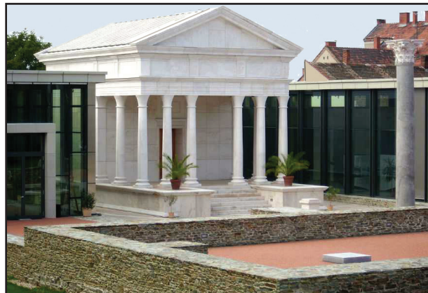
11. kép. Az Izeum

A Főtérről délre, a Bejczy I., majd a II. Rákóczi Ferenc utcán haladva, jobbról az i. sz. II–IV. században működött Izeum (Ízisz-szentély) maradványait láthatjuk. Romjaira 1955-ben, véletlenül bukkantak rá. (Felette a IV. sz.-ban keresztény temetőt létesítettek.) A 42x70 m nagyságú területet 1963-ig régészeti feltárták, a szen-