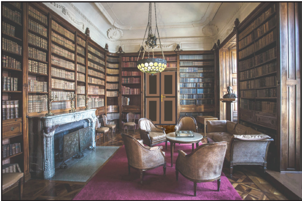
7. kép. A könyvtárszoba