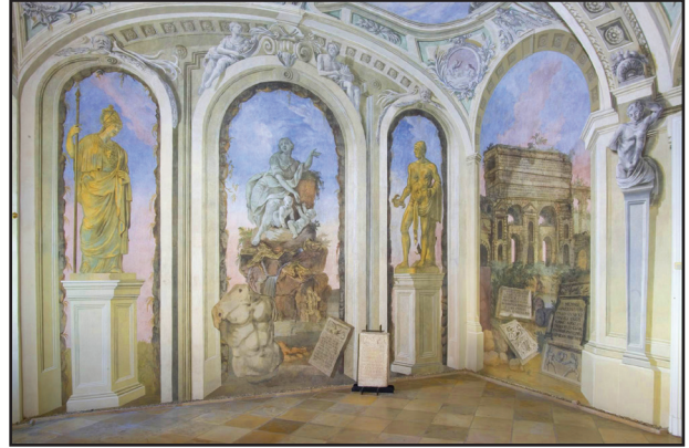
6. kép. A sala terrena