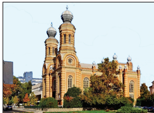
13. kép. Az egykori zsinagóga

tély központi épületét rekonstruálták és látogathatóvá tették. Újabb, tetszesebb rekonstrukció után, múzeumcsarnokokkal kiegészítve 2011-ben nyitották meg ismét a közönség számára (11. kép). A kiállítási épületekben az itt talált domborművek, szobortöredékek és az egykori Ízisz-kultusz emlékei tekinthetők meg. Ízisz-istennő (12. kép) tisztelete Egyiptomból terjedt el a római birodalomban. Anyaistennőnek, a természet és a termékenység istennőjének tartották. Férje Ozirisz, fia Hórusz volt.