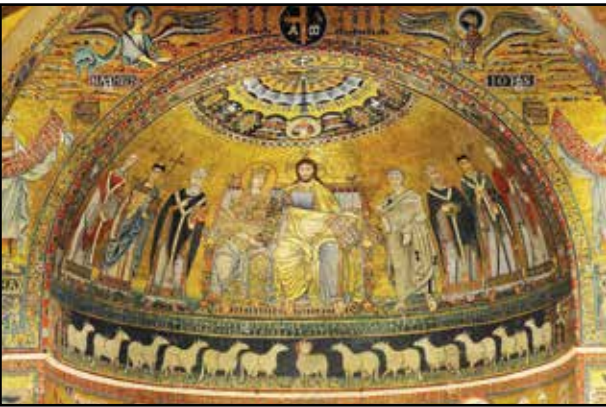
6. kép. S. Maria in Trastevere. Apsismozaik.