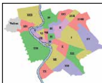
3. kép. A rionek elhelyezkedése.