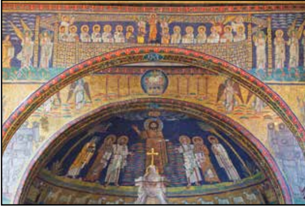
4. kép. S. Prassede. Apsismozaik.