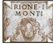
6. kép. Kerületet jelölő tábla

Rione XVII (Sallustiano). A Via XX Settembre külső felétől északra fekvő terület. Címerében kék mezőben