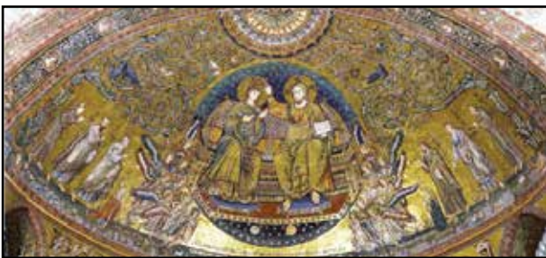
7. kép. S. Maria Maggiore. Apsismozaik.

San Stefano Rotondo , San Primo e Feliziano kápolna (VII. sz.). A két névadó szent a kereszt mellett áll, arany háttérrel.