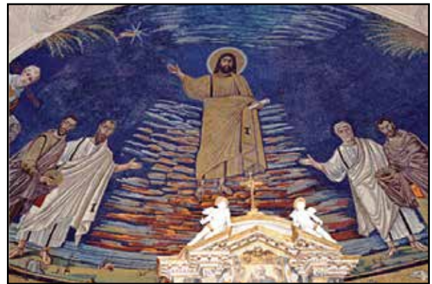
2. kép. S. S. Cosma e Damiano. Apsizmozaik.