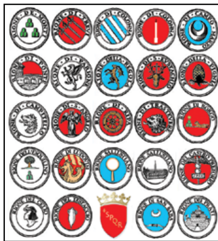
4. kép. A rionek címerei.

nevezték. A XIX–XX. században a perifériás, nagyobb rioneok felosztásával számuk 22-re nőtt, mindegyik saját címerrel büszkélkedett (3. és 4. kép).