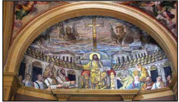
1. kép. S. Pudenziana. Apsizmozaik.

A Santa Pudenzianában látható a legkorábbi és legszebb római apszismozaik (IV. sz., 1. kép). Oldalsó és alsó részét sajnos megcsonkították az apszis átalakítása során. Háttérét felhős ég és egy város látképe alkotja. Az égen a négy evangelista szárnyas szimbóluma (sas, ökör, angyal, oroszlán). Jézus trónon ül a szintén ülő apostolok között. Az utóbbiak mögött két női alak áll. Az arcok finoman kidolgozottak, egyéniek.