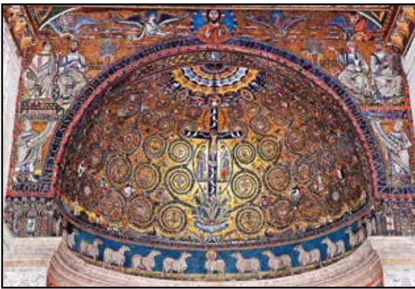
5. kép. S. Clemente. Apsismozaik.