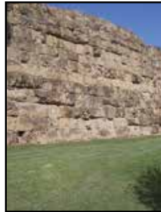
1. kép. A serviusi fal részlete a Piazza dei Cinquecentón.

Róma városát a monda szerint i. e. 753-ban alapították. (Mostani területe kb. 1300 km 2 , lakosainak száma kb. 2,6 millió.) Az i. e. VI. században Servius Tullius király a várost kb. 7 km hosszú védőfállal övezte, amelynek számos részletét még ma is láthatjuk (1. kép). Az első köztársaság korában a „serviusi fal” által határolt területet négy „regio”-ra osztották fel. Augustus császár i. e. 7-ben a régiók számát 14-re növelte. Ezek a városközpontból sugárirányban kiinduló szektorokat képezték (2. kép). A III. században Aurelianus császár a megnövekedett város körül 19 km hosszú, új falat építtetett. A középkorban az „aurelianus falon” belül fekvő területet a régiók összevonásával, hét egyházi kerületre, majd később városnegyedekre (rioni) tagolták. A XVI. sz.-ban 14 volt a rionek száma. Adminisztratív előljárójukat caporione-nak