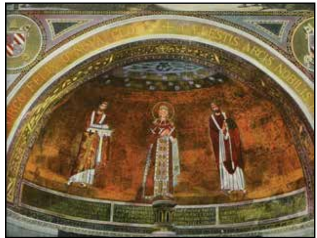
3. kép. S. Agnese. Apsizmozaik.

San Lorenzo fuori le Mura (VI. sz.). Apsizis mozaikja elpusztult, másolatát azonban a diadalív megőrizte. Jézus öt szent és II. Pelagius pápa között a földgömbön ül, baljában pálca. A pápa kezében a templom modellje.